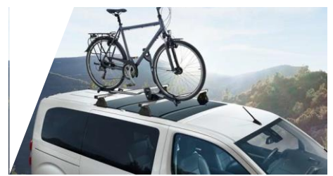
Strešný nosič bicykla Thule "Expert 298" Číslo dielu: 1642748780 Cenníková cena: 168,62 €