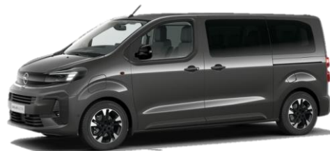
Šedá Merkur (1JM0) 650 €