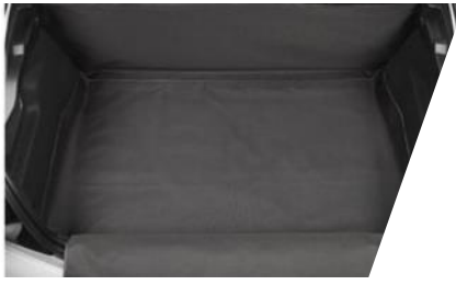
Podložka do nákladného priestoru odolná podložka, účinne chráni nákladný priestor. Ideálne na prepravu domácich zvierat. Číslo dielu: 1607075780 Cenníková cena: 61,87 €