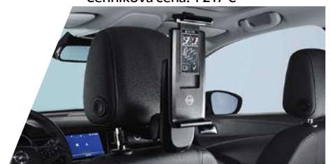
FlexConnect držiak tabletu (univerzálny) potrebné objednať FlexConnect adaptér Číslo dielu: 39092067 Cenníková cena: 231,23 €

Kompletnú ponuku príslušenstva nájdete na: OPEL PRÍSLUŠENSTVO