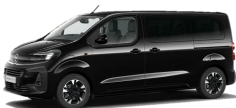
Čierna Karbon (9VM0) 650 €