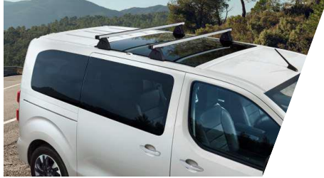
Priečny strešný hliníkový nosič – 1 ks. strešné tyče z anodizovaného hliníka. Upevnenie do kotviacich bodov v streche. Max. záťaž: 100 kg/2nosiče, 150kg/3nosiče. Číslo dielu: 1612491580 Cenníková cena: 208,84 €