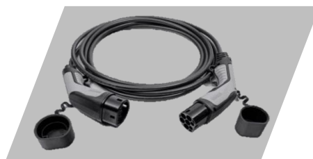
Kábel režimu 3, 6 m pripojenie do nabíjacej stanice (domácej alebo verejnej) 1 fáza-7,4 kW-32A-č.dielu: 9844681180 - 421 € 3 fázy-11 kW-3x16A-č.dielu: 9844681280 - 246 € 3 fázy-22 kW-3x32A-č.dielu: 9844681480 - 478 €