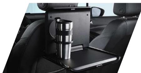
FlexConnect sklápny stolček potrebné objednať FlexConnect adaptér Číslo dielu: 13442006 Cenníková cena: 177,41 €