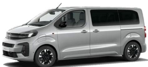
Šedá Kontrast (F4M0) 650 €