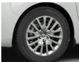
17" x 7,0 čierne ocelové disky s celoplošnými krytmi (ZHYY)