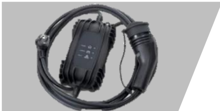
Kábel režimu 2 – typ EF, 1 fáza – 8 A – 6 m, pripojenie do domácej zásuvky Číslo dielu: 9846744480 Cenníková cena: 420 €