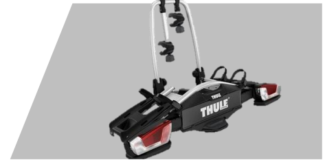
Nosič pre 2 bicykle na ťažné zariadenie Jednoduchá montáž bicyklov vďaka odnímateľným fixačným ramenám, nosnosť 46kg Číslo dielu: 1629425880 Cenníková cena: 715,58 €