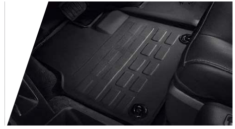
Predný gumový koberec monoblok Ochráni podlahu pred znečistením a vlhkosťou, snehom a nečistotou. Číslo dielu: 1662447180 Cenníková cena: 67,99 €