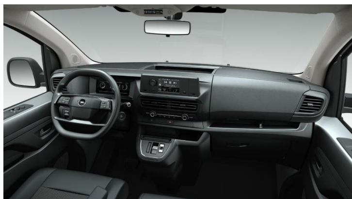
Látkové čalúnenie Curitiba Monoton, šedá palubná doska Bitone 43FT - Combi