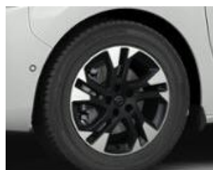
Disky z ľahkej zliatiny 17" x 7,0 J strieborné Diamond Cut (ZHZN)