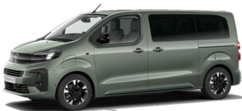
Zelená Kapari (DUM0) * 650 €