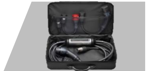
Kábel režimu 2 – Univerzálny, Súprava s nabíjacou jednotkou IC-CPD, max. 22 kW, konektor, typu 2 pre vozidlo a 3 adaptéry pre pripojenie k elektrickej sieti (Typ2+CEE16/ 3p+CEE7/7) Číslo dielu: 9846031380 Cenníková cena: 1 217 €