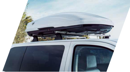
Strešný box Thule box s exkluzívnym dizajnom, znížený odpor vzduchu, hluk a vibrácie. Dvojité bočné otváranie. Nosnosť 75kg Rozmery: 218x90x40 cm. Objem: 470 l Číslo dielu: 1662444480 Cenníková cena: 1153,94 €