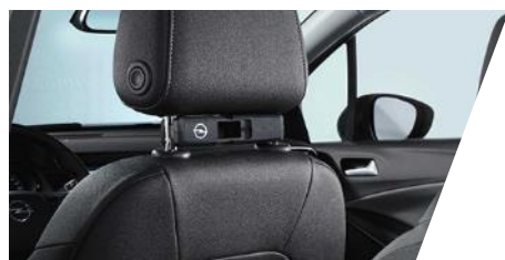
FlexConnect adaptér Číslo dielu: 13442005 Pôvodná cena: 59 €