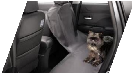
Ochranný poťah na zadné sedadlo Umývateľná deka na ochranu zadných sedadiel. Upevnenie suchými zipsami na opierky zadných sedadiel Číslo dielu: 1607075880 Cenníková cena: 45,92 €