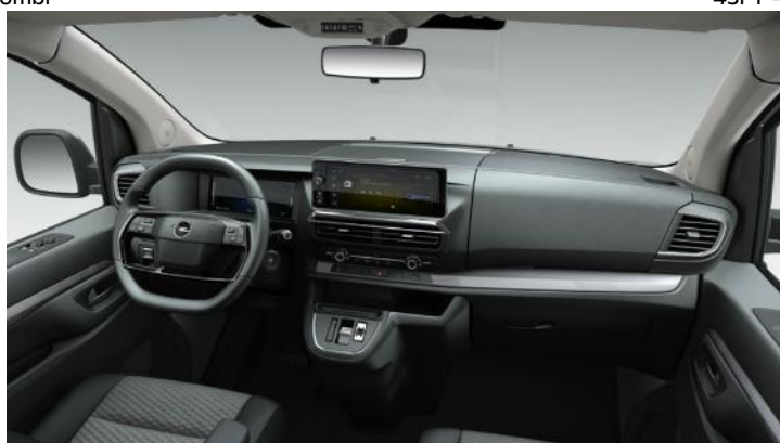
Látkové čalúnenie Rimini, čierna palubná doska BRFY - Zafira Edition