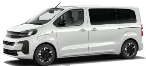
Biela Kaolin (PRP0) 0 €